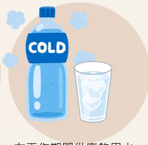
在工作期間供應飲用水 讓員工隨時飲用