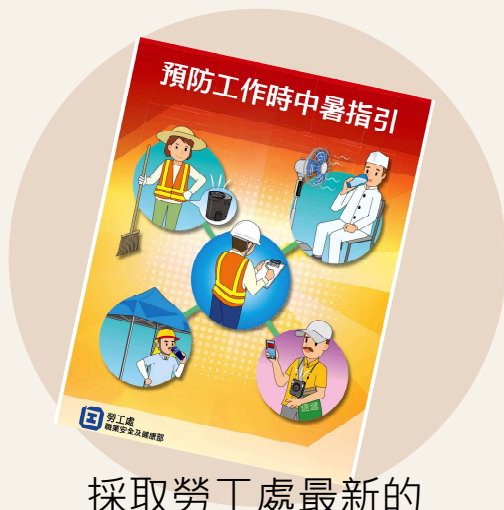
採取勞工處最新的 《預防工作時中暑指引》 中提出的措施