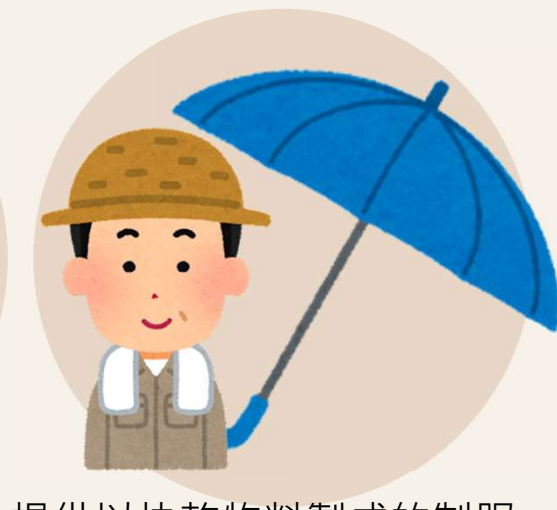
提供以快乾物料製成的制服； 提供闊邊帽、防曬手袖或傘子